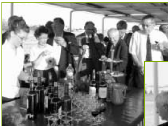
À la découverte de la Garonne