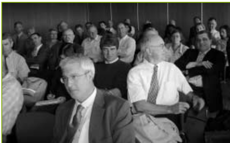
Succès réussi pour la conférence sur le carbone

La convention annuelle de la Saf s'est tenue à Bordeaux, les 25 et 26 mai 2005. Retour en images sur deux jours particulièrement intenses et conviviaux.