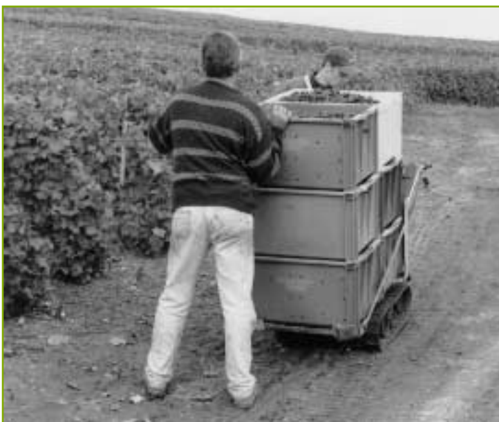
La commission entreprise aura à se pencher, dans les mois qui viennent, sur une problématique aujourd'hui centrale : celle de la formation des futurs chefs d'entreprise agricole et rurale.

En outre, la commission l'avait déjà souligné l'année dernière, le phénomène d'externalisation du travail tend à se développer avec le recours notamment aux services de Cuma avec salariés ou d'entrepreneurs de travaux agricoles. Les membres de la commission ont pu souligner que le travail salarié constitue une composante essentielle de l'entreprise agricole et rurale, apparaissant très fréquemment lié à la dynamique de son développement. Or, la conduite d'une activité de culture ou d'élevage nécessite aujourd'hui de réelles compétences techniques et de solides qualifications. Il est par conséquent essentiel que le profil de l'employé en agriculture