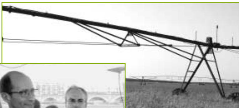
Du maïs, du maïs, encore du maïs !