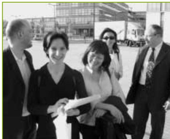
Embarquement avec les permanents de la Saf